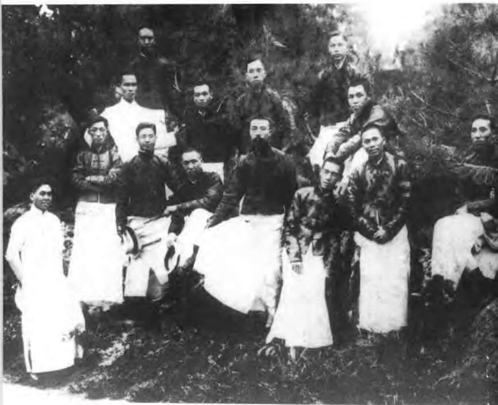
李大钊与《晨钟报》编辑部同人的合影（前排左5为李大钊）