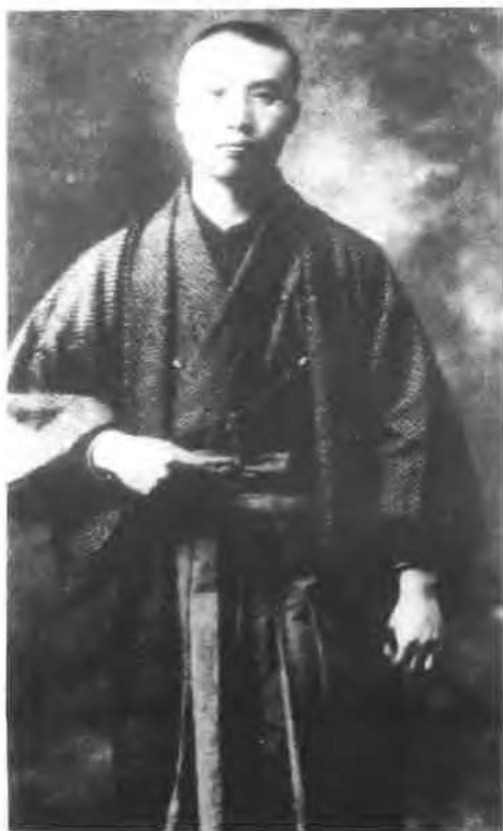
1914年2月，李大钊在日本东京的留影