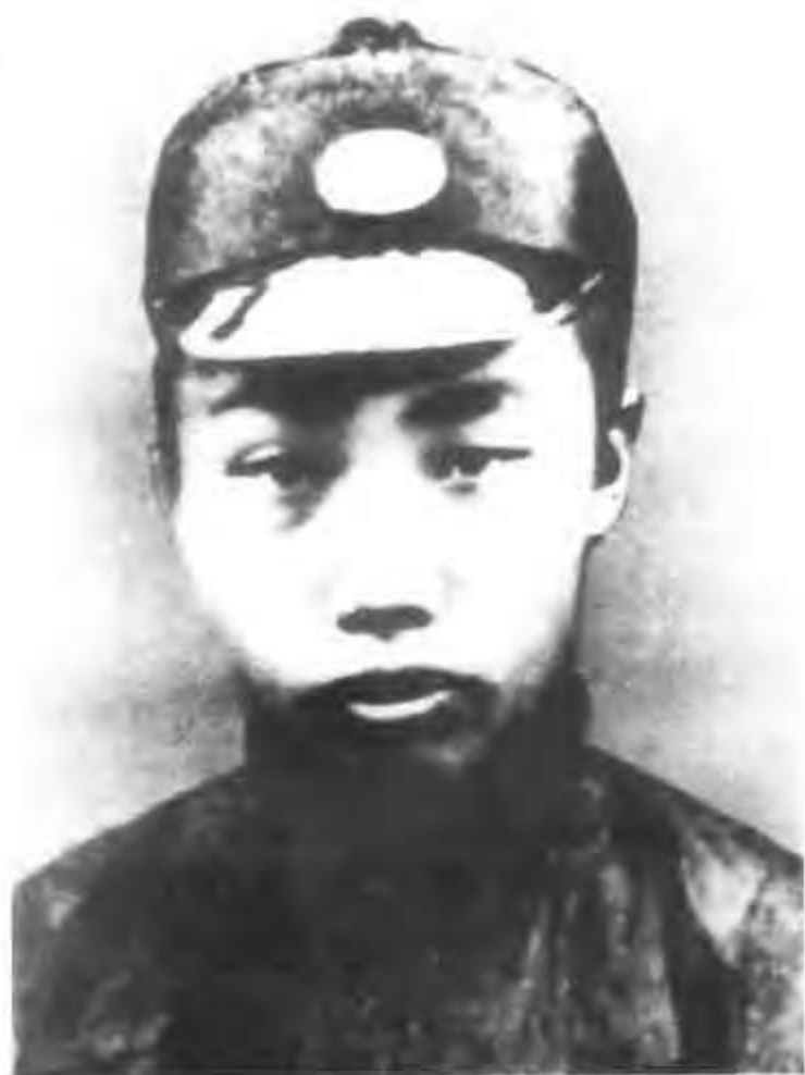
1905年在永平府中学堂读书时的李大钊