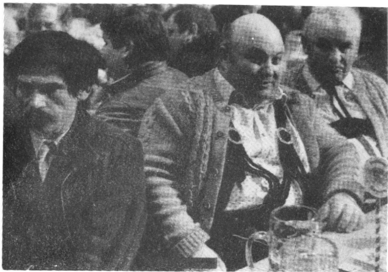
「阿里」是不受欢迎的外国人