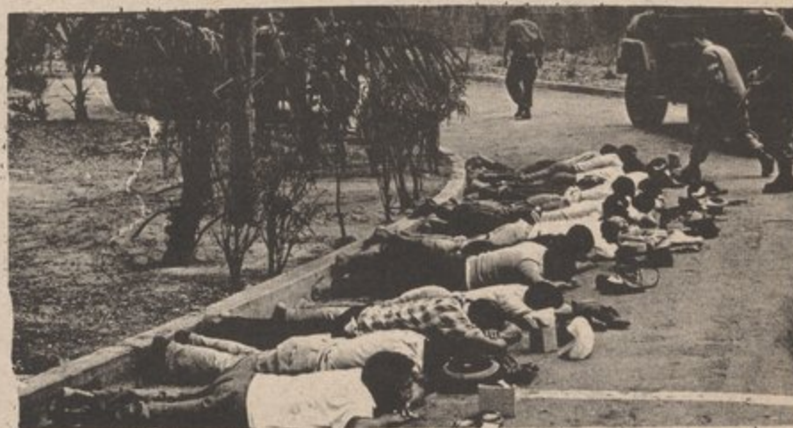
A LA MANC DERECHA SE VEN LOS VERDADEROS ENEMIGOS - LOS YANQUIS

VIVA PUERTO RICO Y QUISQUELLA LIBRE Y SOCIALISTA!