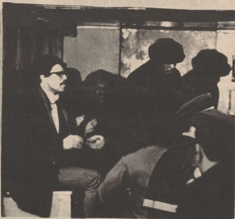
MIEMBROS DE LA U.E.B. ARRESTADOS CON EL PARTIDO EN LA PRIMERA IGLESIA DEL PUEBLO 1/7/70

PRSU ha contribuido mucho a la lucha. Para seguir en su crecimiento, PRSU debe luchar contra ciertos problemas dentro de la universidad así como en las filas de la organización. El problema principal en el movimiento estudiantil es que el representan los oportunistas,