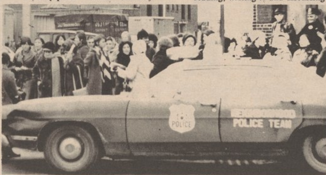
LEVITON WORKERS-WON'T BE STOPPED

We can do this by talking and listening to each other and by reading, writing to and discussing