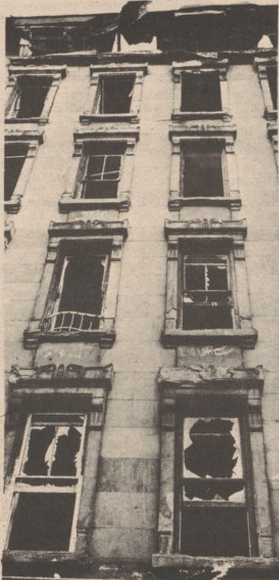
WE MUST SEIZE CONTROL OF OUR HOMES AND REBUILD THEM.

Aida Maldonado one of the workers of an anti-poverty program went around to stores in and out of the communities to get donations. A lot of the stores donated food and candles for the families in the building. She also went to a travel agency and received two pots of rice and beans and two pots of chicken. Three brothers helped out with the electricity and gas. In the very beginning of the strike, the lights were turned off and these brothers knew something about electricity and turned the lights back on.