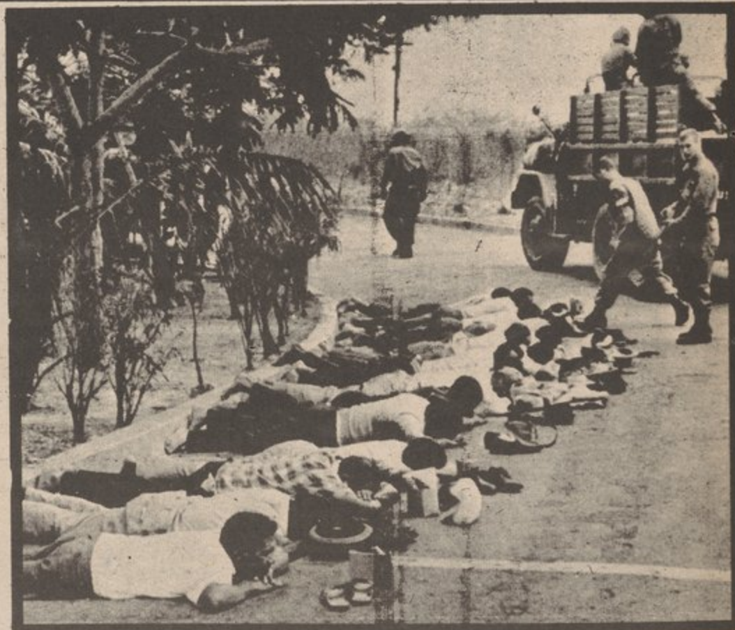
RIGHT HAND CORNER SHOWS THE ENEMY OF THE WORLD'S PEOPLE U.S. IMPERIALISM

LONG LIVE A FREE AND SOCIALIST PUERTO RICO AND QUISQUELLA!