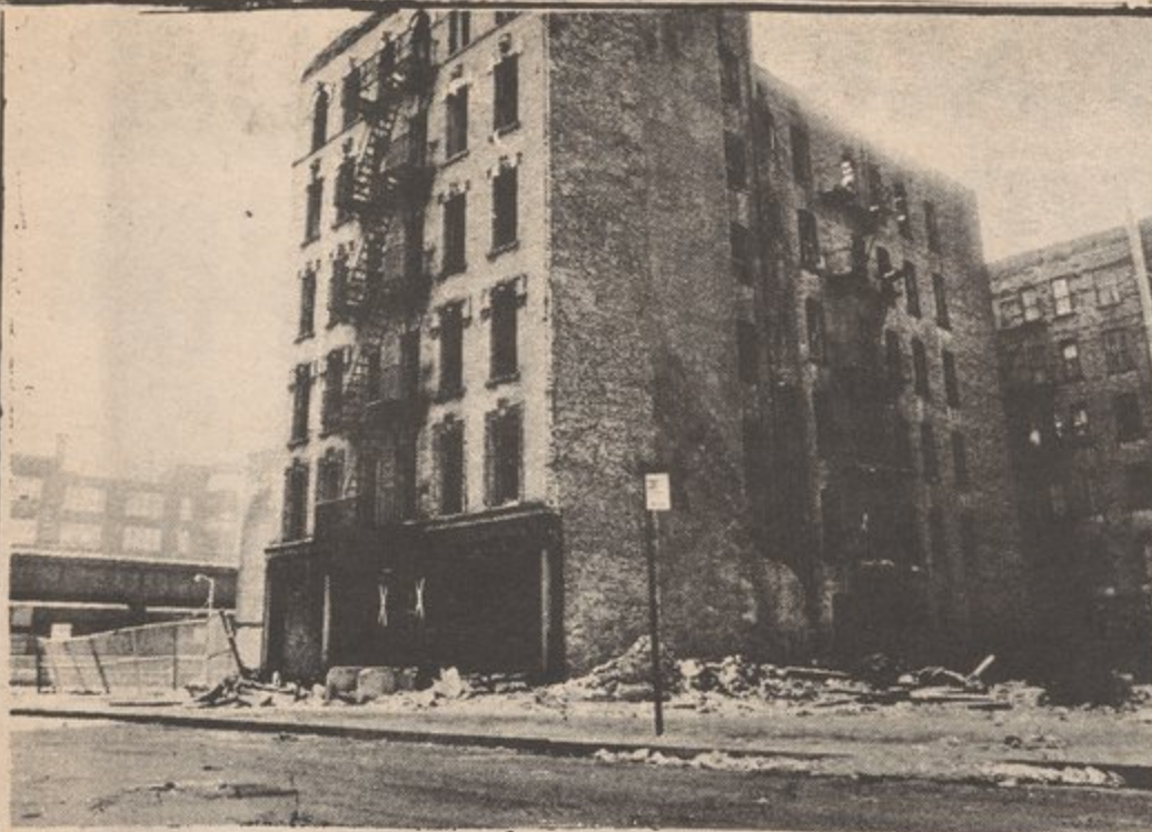
TENEMOS QUE TOMAR CONTROL DE NUESTROS HOGARES Y MEJORARLOS