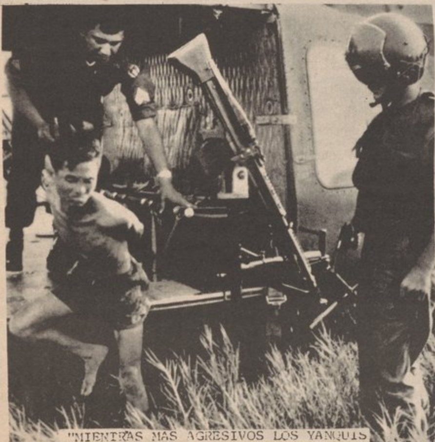
“MIENTRAS MAS AGRESIVOS LOS YANQUIS