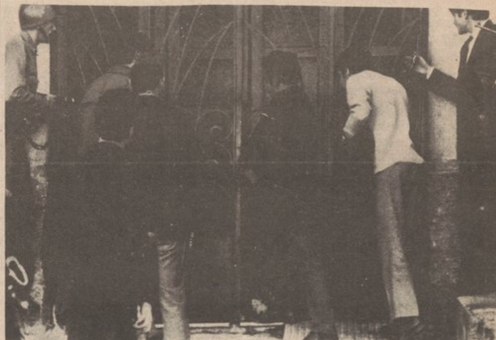
TROPAS Y POLICIA DEL GOBIERNO LLEVAN A CABO BUSQUEDA DE CASA A CASA EN BUSCA DE TUPAMAROS.

Desde 1966, ha habido una guerra en Uruguay entre el pueblo pobre y su organizacion Movimiento Liberacion Nacional (Los Tupamaros) - en contra el gobierno y los ricos de Uruguay,