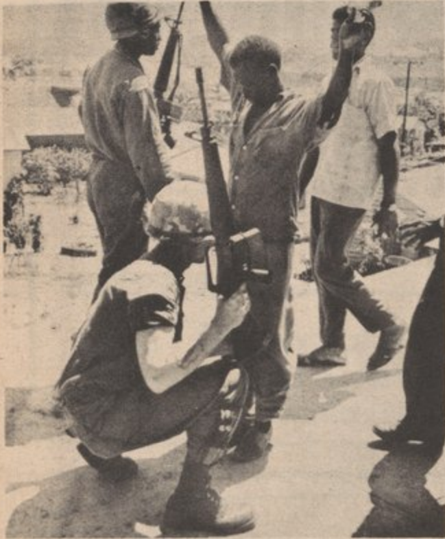
1965 EN SANTO DOMINGO LOS YANQUIS REBUSCAN PRINTOR