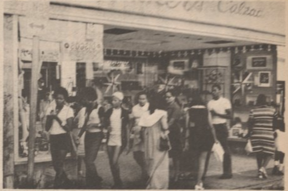
WHILE THE PEOPLE SUFFER UNEMPLOYMENT THE RICH EAT WELL

recent demonstration in Arecibo sponsored by the PPD, hernandez colon said his party (PPD) will not win the elections in the manner that the