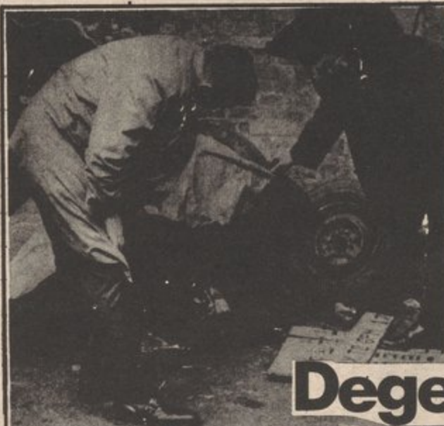
Two victims executed during gang violence that followed Joey Gallo's assassination in Manhattan clam house.