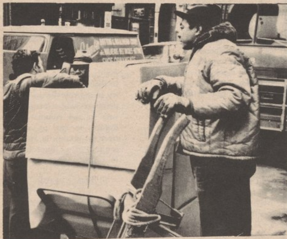
"WE WORK ALL DAY FOR A LAZY MINORITY THAT RIPS US OFF OF OUR LABOR."

PRSU has contributed much to the struggle. In order to continue in its development, it must struggle against certain ideas on campus and within the organization. The worst problem today within the students' movement are the opportunists, individuals who move out of a