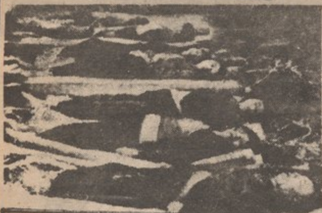
VICTIMS OF A U.S. BOMBING