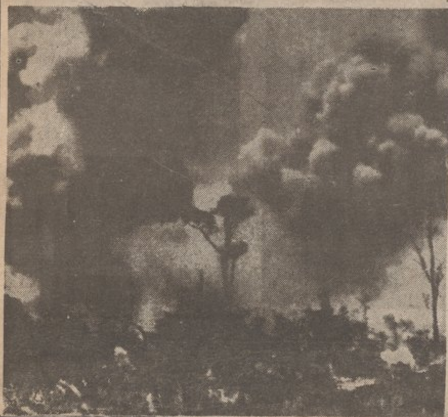
U.S. BOMBINGS IN N. VIETNAM