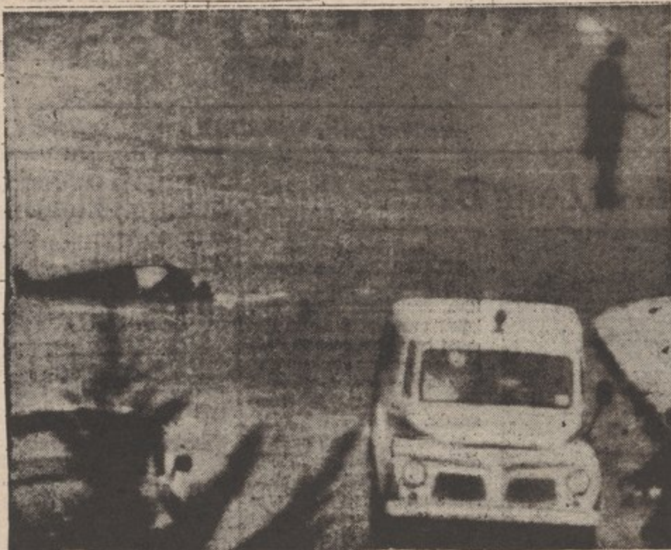
TANKS, BULLETS, TROOPS CAN'T STOP THE STRUGGLE OF THE PEOPLE..

Rumors have spread that Raul Sendir and Antonio Carden, courageous leaders of the people and founders of the Tupamaros, were killed in a shoot-out during the week. More than 19 have been killed already - out of