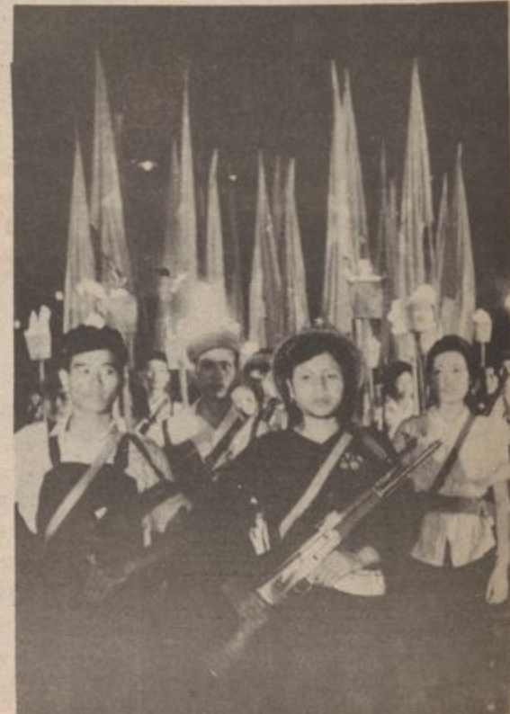
THE WAR MAY LAST 5, '10, 20 YEARS BUT THE VIETNAMESE PEOPLE WILL NOT BE INTIMIDATED-