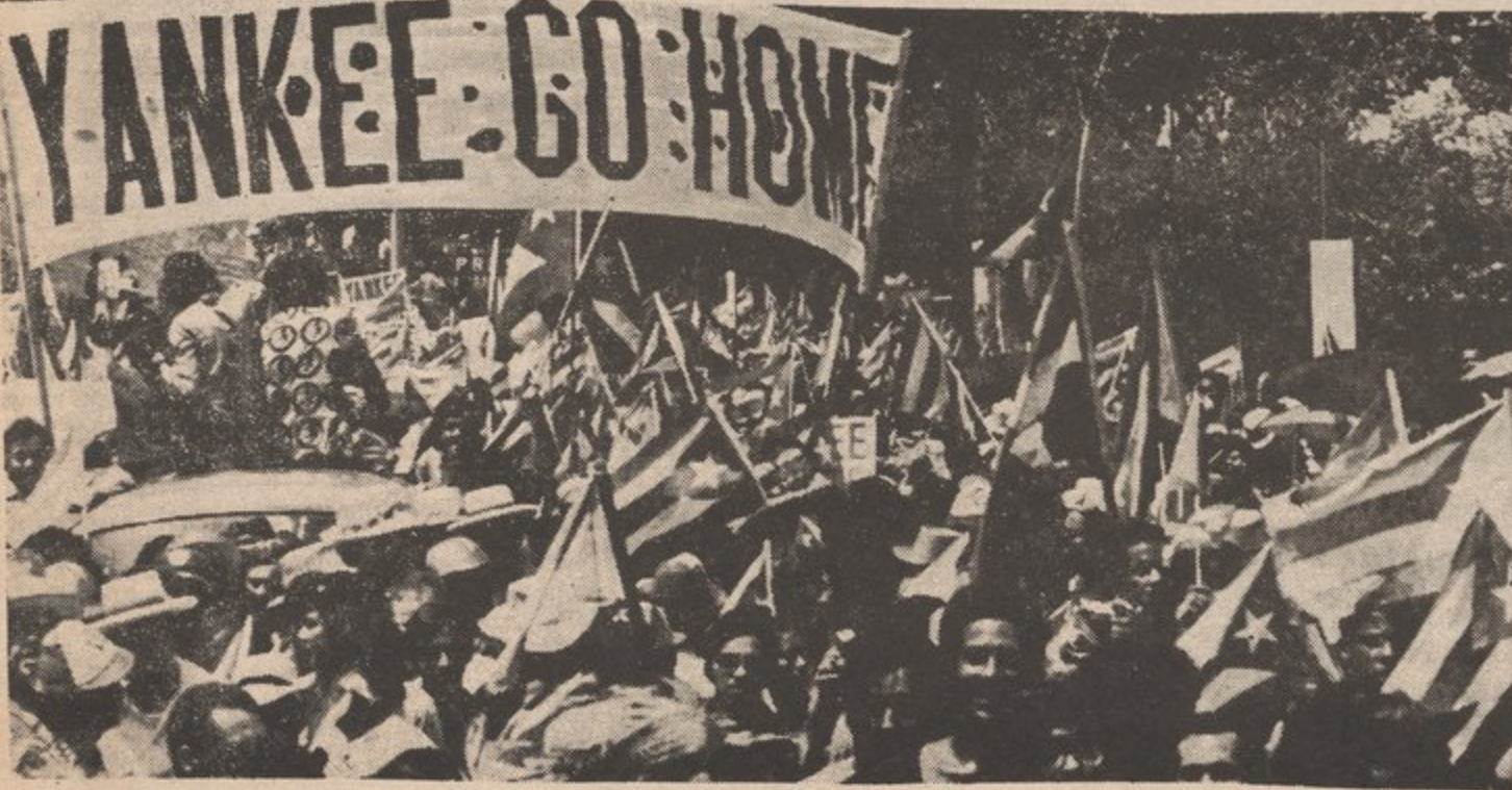
IN PUERTO RICO WE PREPARE TO KICK THE YANKEES OUT

La historia ha al imperialismo nos toca a llevar acabo sentencia.