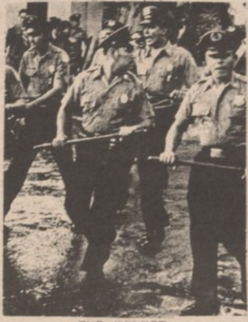
THE POLICE PROTECT THE RICH POLITICIANS

Now, let's talk about the PPD in Puerto Rico. This party represents the liberal element of the rich class. They are the ones that try different ways to suppress a revolutionary movement. Like munoz marin offering the imprisoned Nationalists of the 1950's liberty from imprisonment if they would only not talk about the Nationalist movement and would denounce the Nationalist Party. Or like R hernandez colon offering money to the YLP in the city of New York in June of 1971. This was just before the Puerto Rican Day Parade. He offered money if we were not to participate in the parade. In a