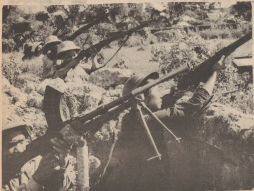
THE YANKEES MAY SEND MORE TROOPS AND THE VIETNAMESE PEOPLE WILL CONTINUE TO FIGHT UNTIL THE U.S. ADMITS DEFEAT!