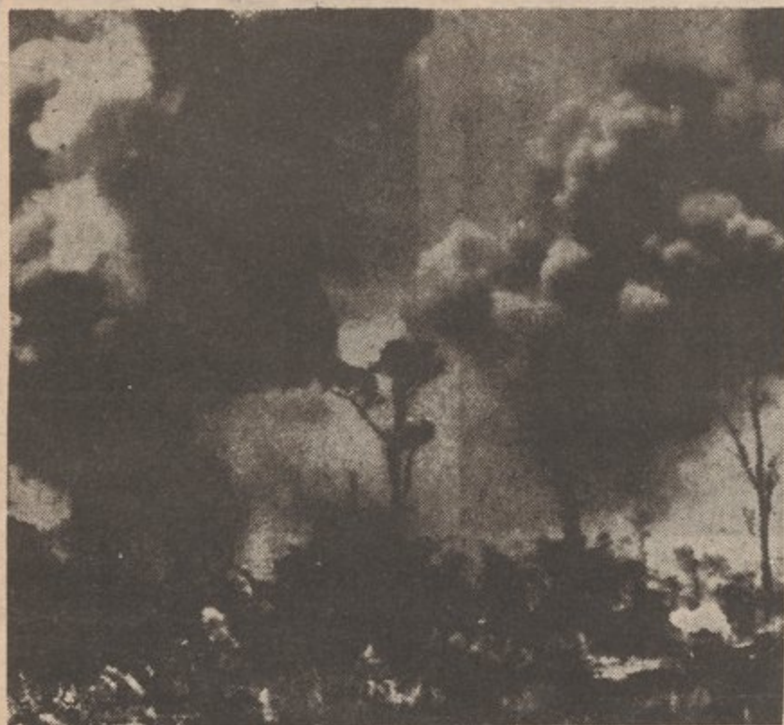
E.U. BOMBARDEA VIETNAM DEL NORTE