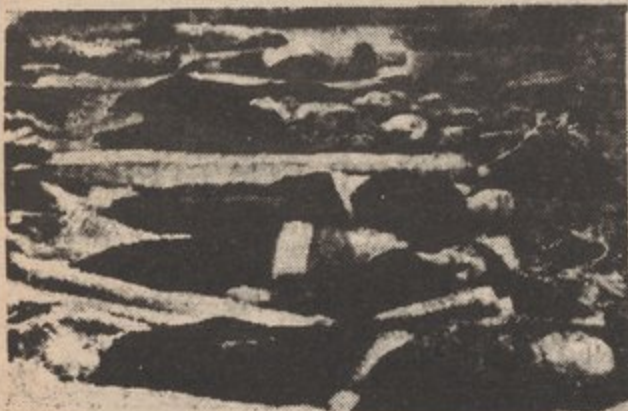
VICTIMAS DE LAS BOMBAS AMERIKKANAS