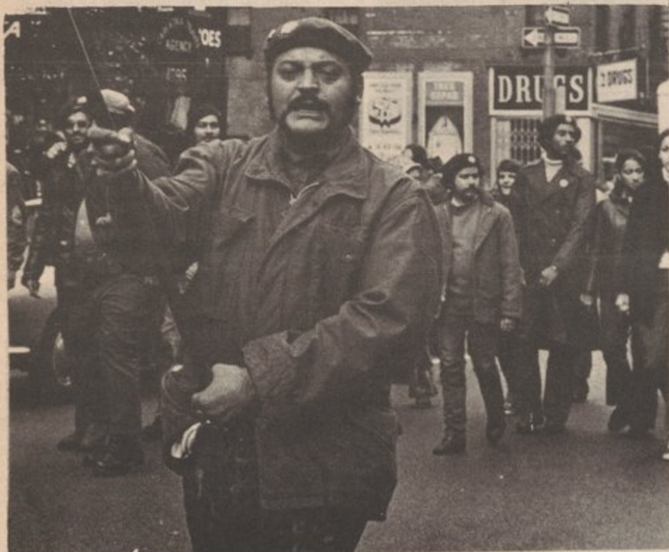
"IN THE UNIVERSITIES, HIGH SCHOOLS - WHEREVER WE ARE WE WILL FIGHT UNTIL PUERTO RICO IS FREE"

A strong, anti-imperialist Puerto Rican student movement is being built today. It is growing on the East Coast of the United States, but has been struggling for some time in New York. In fact, the current student movement began there on April 22, 1969, the day Puerto Rican and Black students took City College of New York (CCNY).