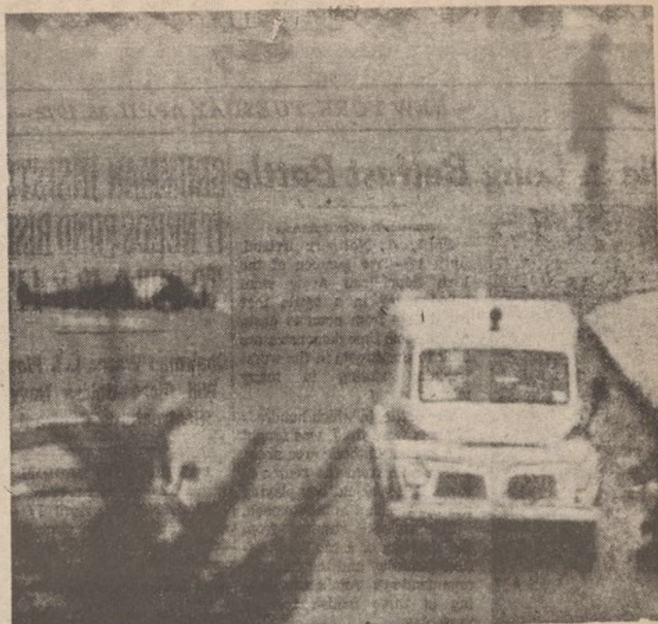
NI TANQUES, BALAS, TROPAS, PARAN LAS JUSTAS LUCHAS DE LOS PUEBLOS SUFRIDOS

PALANTE TUPAMAROS! ABAJO CON EL GOBIERNO BORDABERRY VIVA PUERTO RICO LIBRE Y SOCIALISTA!