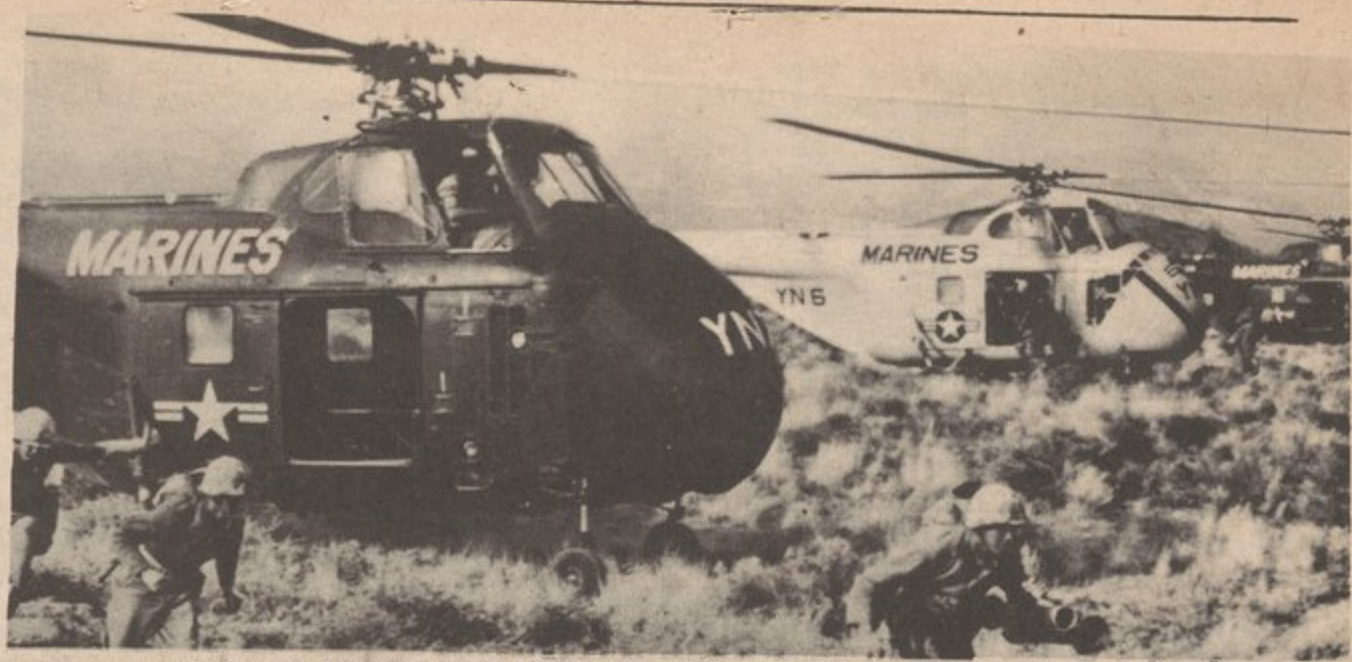
TODAY THEY LAND IN VIETNAM, SANTO DOMINGO, LAOS, TOMORROW ????? HOY ATERIZAN EN VIETNAM, SANTO DOMINGO, LAOS, MANANA ?????