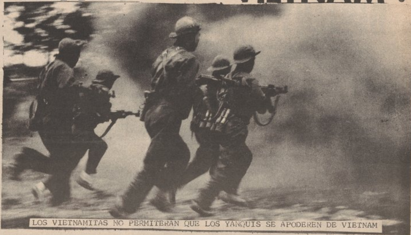
LOS VIETNAMITAS NO PERMITERAN QUE LOS YANQUIS SE APODEREN DE VIETNAM

La realidad de las cosas son que en el norte de Vietnam los obreros están en poder, el partido laboral de Vietnam del Norte busca lo mismo para el sur, reunificación de la patria, poder para los obreros y establecimiento del socialismo en todo el país: la felicidad del pueblo en general; cosa que no puede ser realizada mientras Haya una tropa norteamericana interviniendo en la vida del