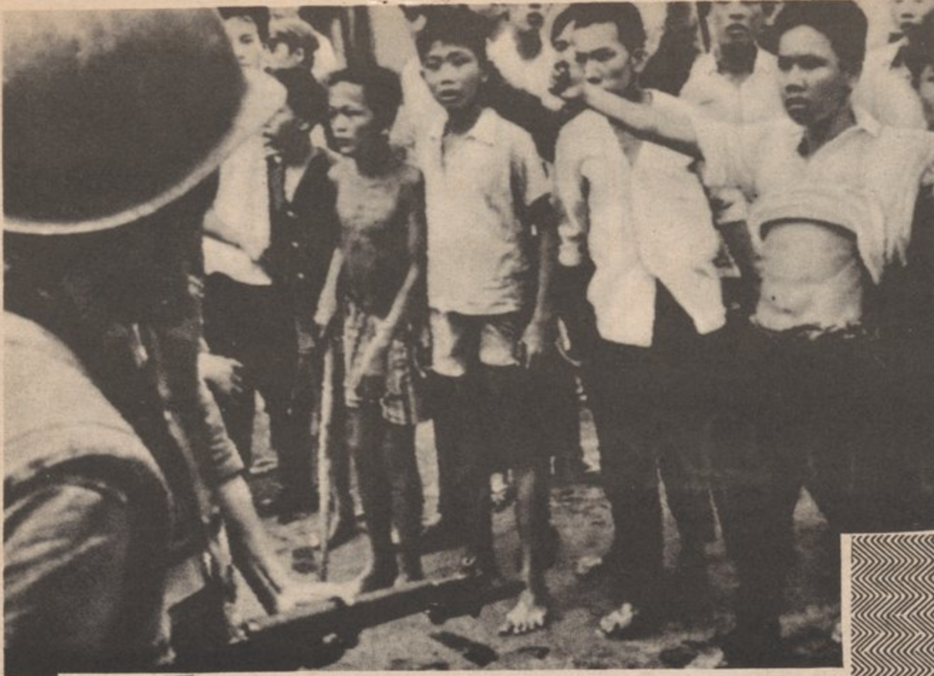
IN VIETNAM BEFORE WE KNEEL TO THE INVADERS WE PREFER TO DIE STRUGGLING EN VIETNAM ANTE DE ANANGOTARNOS A LOS INVASORES MEJOR MORIMOS LUCHANDO