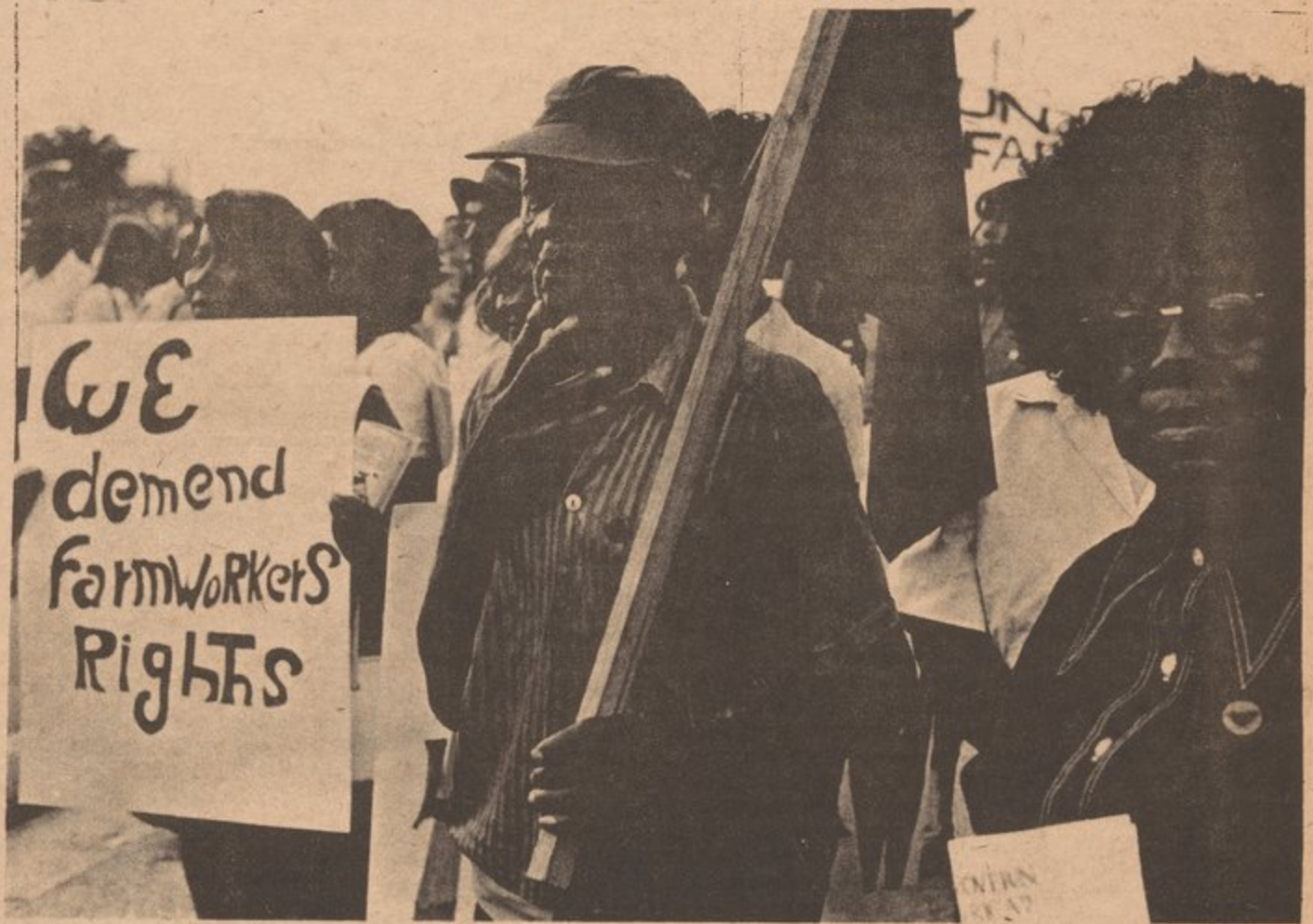
OBROSOS AGRICOLAS ORGANIZAN PARA PROTESTAR CONDICIONES

Los trabajadores agrícolas tienen una larga historia de lucha contra estas condiciones. Un punto claro en su historia fue cuando en 1966 la Asociación de Trabajadores Agrícolas Nacionales surgió, con un Comité Organizador de Agricultura y formaron el Comité Organizador de Trabajadores Agrícolas Unidos (UFWOC) con Cesar Chavez como director. Entonces hubo un grupo representativo para los trabajadores agrícolas. Desde el 1966 el UFWOC peleó contra los agricultores de