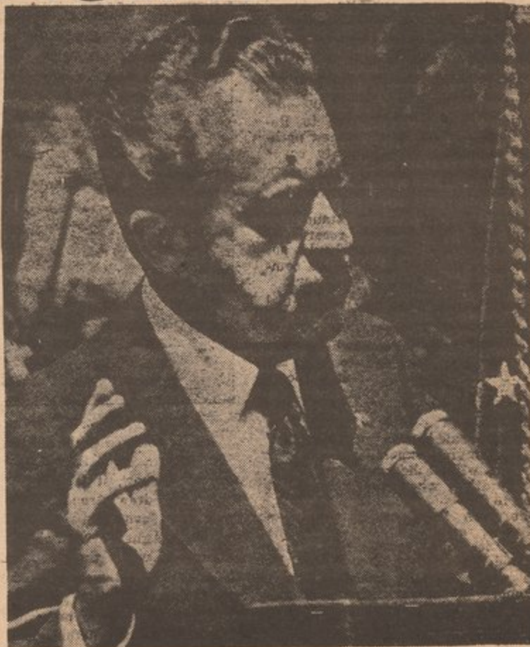
TRATANDO DE SALIRSE CON MENTIRAS

Los unicos que pueden acabar con la charlatanería en total son la gente que verdaderamente trabajan y producen todo para este pais. Solo estos, bajo un partido que surja de la lucha de la clase obrera podra acabar con un sistema que es explotador e inhumano. Así que podemos decir que las investigaciones se tienen que mirar como lo que son, un medio de la clase dominante para bregar con sus delincuentes realengos.