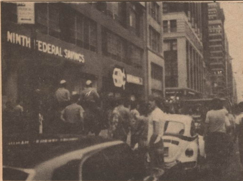
UNPROVOKED POLICE ATTACK ON CAMBODIA DEMONSTRATORS.

POLICIA ATACAN MANIFESTANTES CONTRA EL BOMBARDEO CAMBOYENSE, SIN PROVOCAACION.