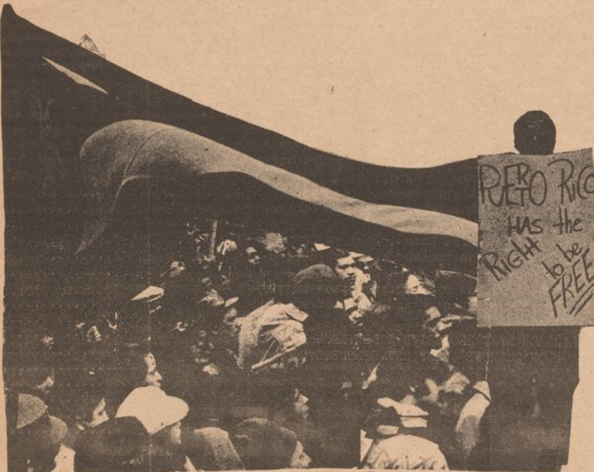
Puerto Ricans in the U.S. demand that "Puerto Rico has the right to be free!"