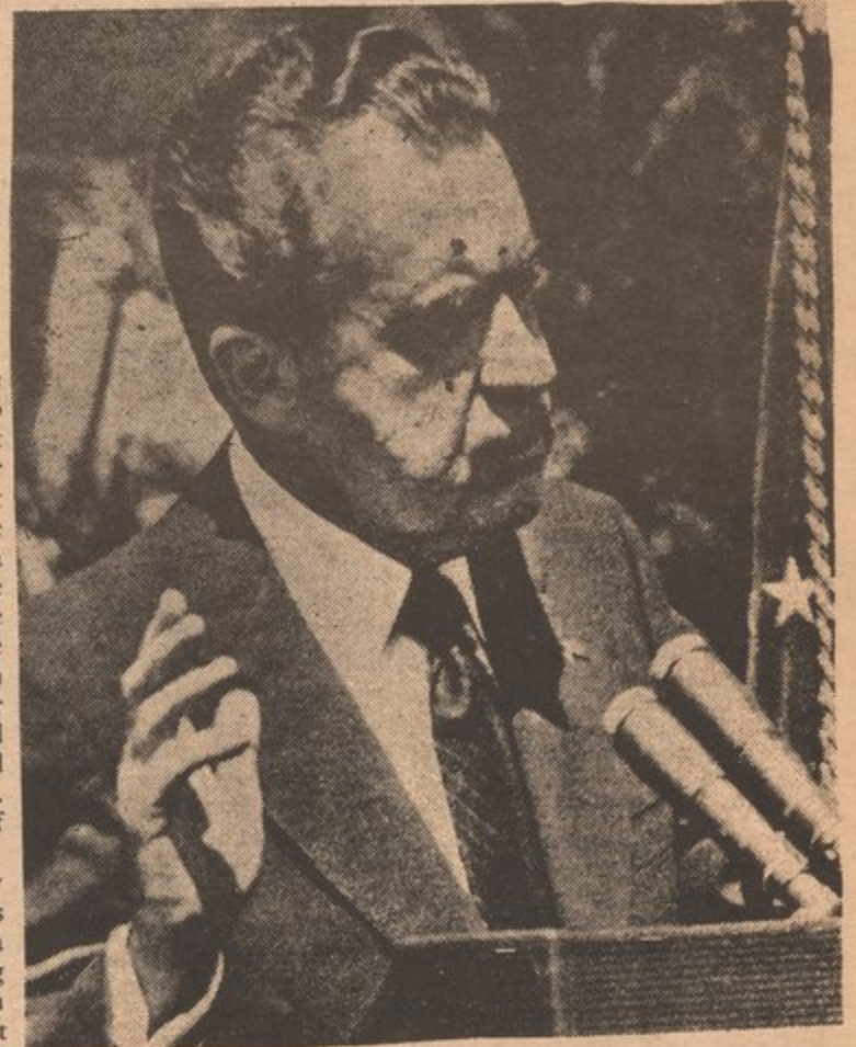
TRYING TO LIE HIS WAY OUT

The only ones who can put an end to this fakery are those who in actuality work and produce for this country. Only these people under the leadership of a party that arises from the struggles of the working class can totally change this exploitative and inhuman system. We have to look at these hearings for what they are, a method by which the ruling class deals with its wayward delinquents.