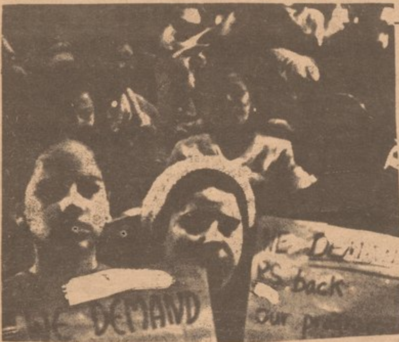
PARENTS, CHILDREN, AND COMMUNITY RESIDENTS DEMAND BETTER EDUCATION

In the last couple of months we have seen a number of events that tell us loud and clear that parents must fight to protect the rights of our children.