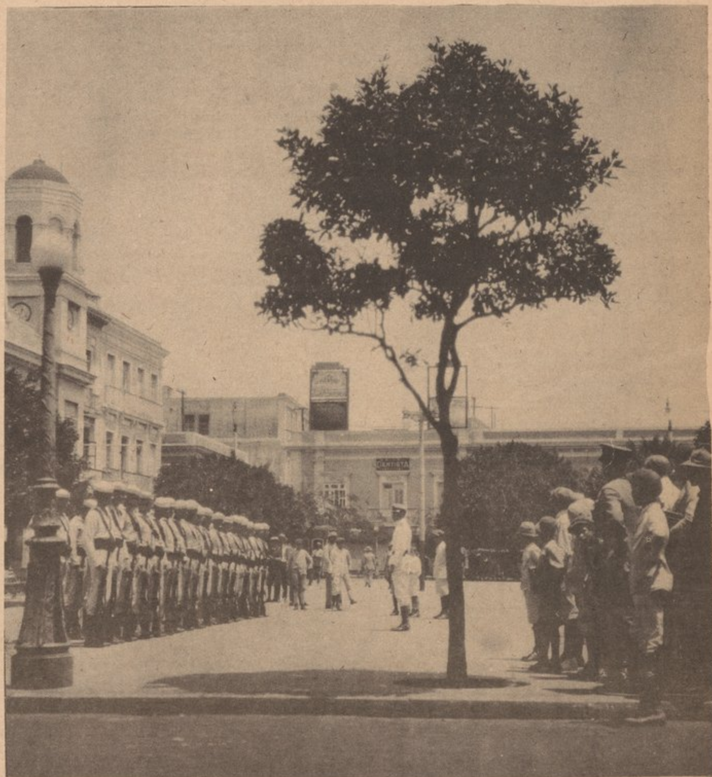
EN LA PLAZA DE ARMAS EN SAN JUAN, PUERTO RICO, (1935)

Que representa esto para nosotros? Representa oportunidades para nuestros gloriosos hombres jovenes de la republica, los mas valerosos, ambiciosos, impacientes, y mas militantes que el mundo ha llegado a conocer. Significa que los recursos y el comercio de estos territorios con sus inmensos riquezas seran aumentadas porque la energia Americana es mas que la flojedad Espanola; desde ahora los Americanos monopolizaran esos recursos y comercio."