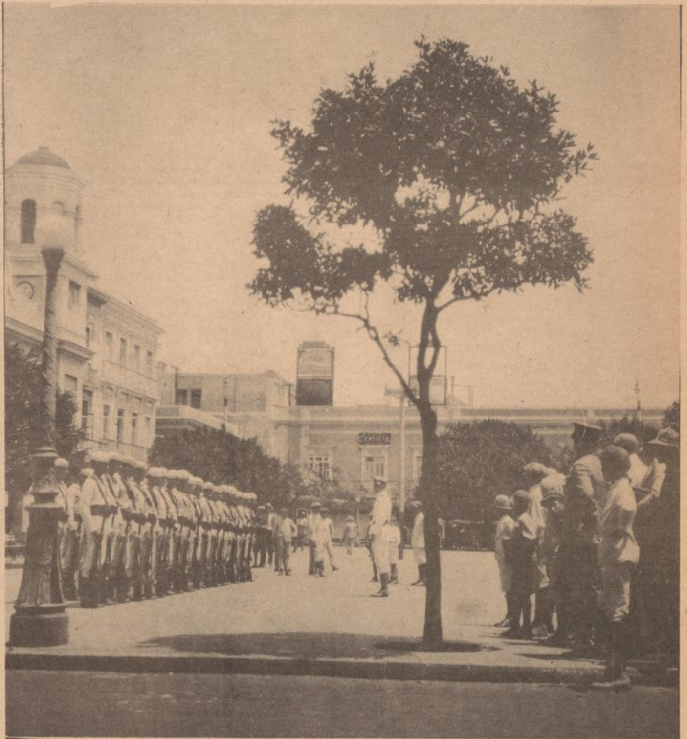
American sailors lined up in the Plaza de Armas in San Juan, Puerto Rico (1905)

"When the American capitalists realizes that there is a surplus of labor accustomed to the Tropics and that the return of capital is exceedingly profitable, it is my feeling that he will come here..."