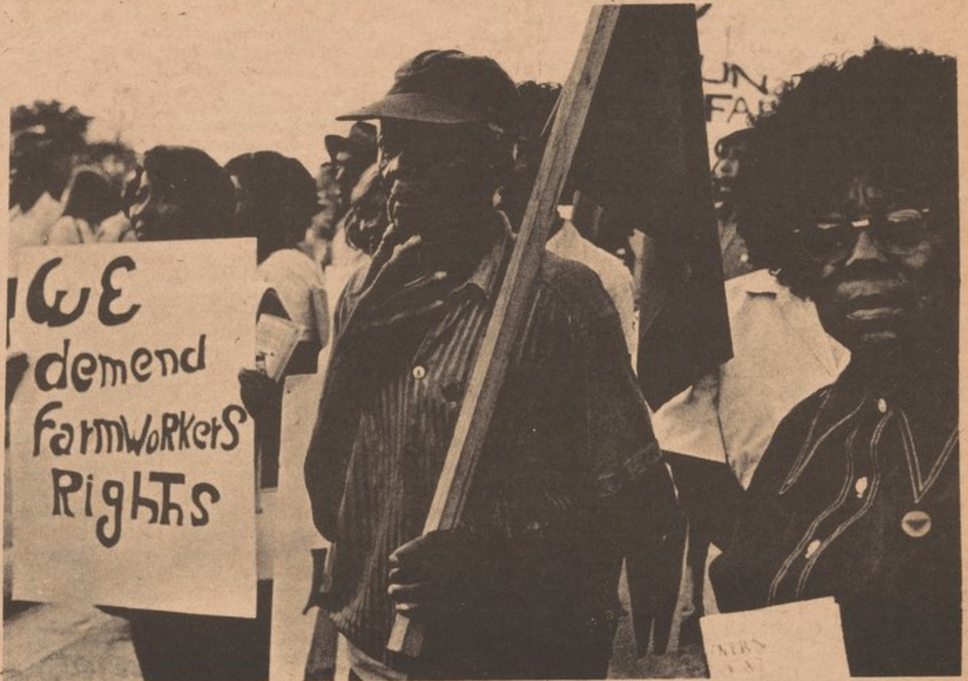
FLORIDA FARM WORKERS ORGANIZE TO PROTEST CONDITIONS

The U.F.W. has called a nationwide boycott on non-union lettuce and grapes, and is presently striking lettuce and grape growers in California. Or