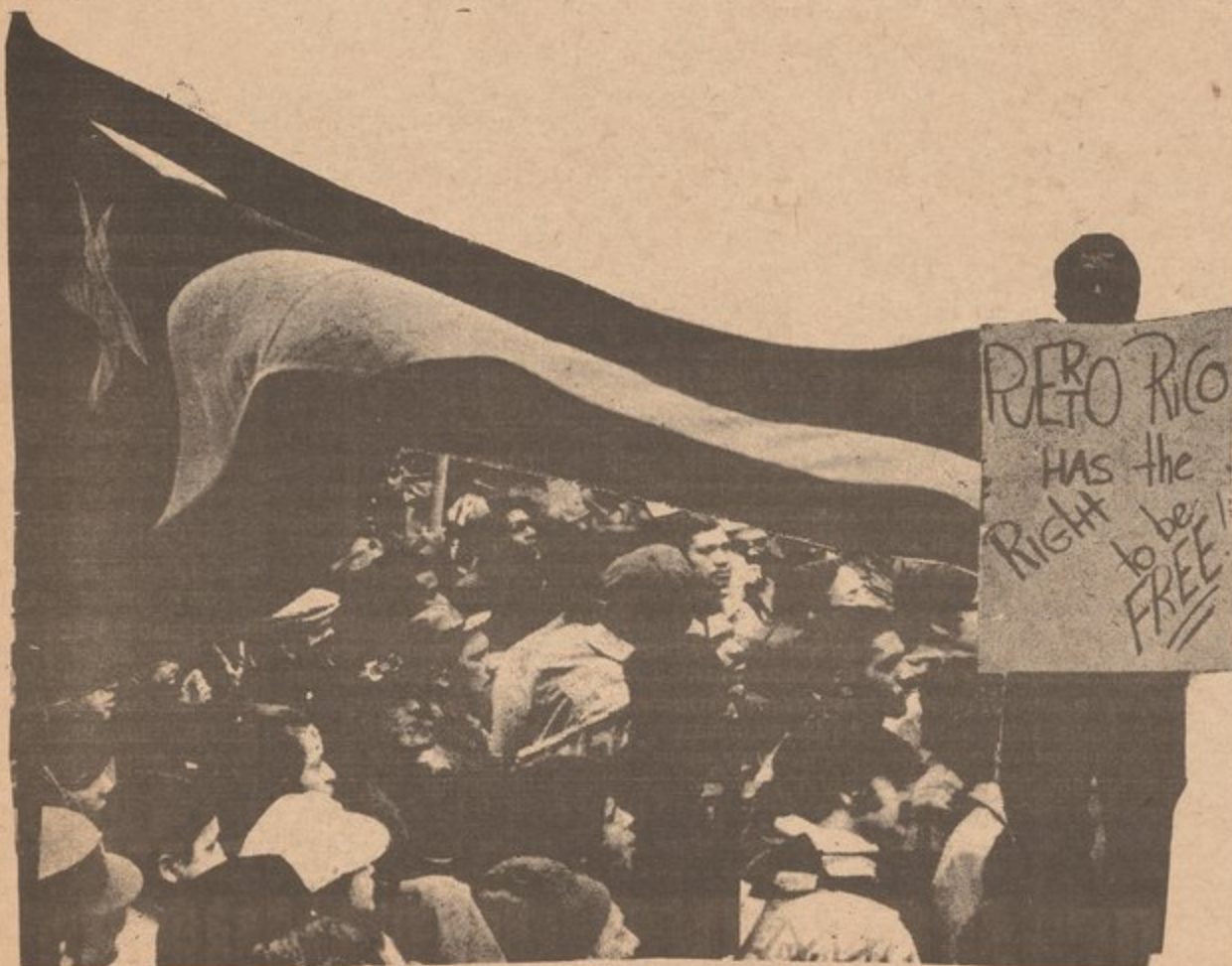
Puertorriqueños en los Estados Unidos demandan que "Puerto Rico tiene el derecho de ser libre!"

Un portavoz del Comité Unitario le informó a CLARIDAD que durante las semanas venideras se espera que se unan mas organizaciones al Comité. En la actualidad lo integran: el Puerto Rican Revolutionary Workers Organization (PRRWO); el Comité; Centro de Estudios Puertorriqueños; Congreso de Pueblos; Partido Socialista Puertorriqueño.