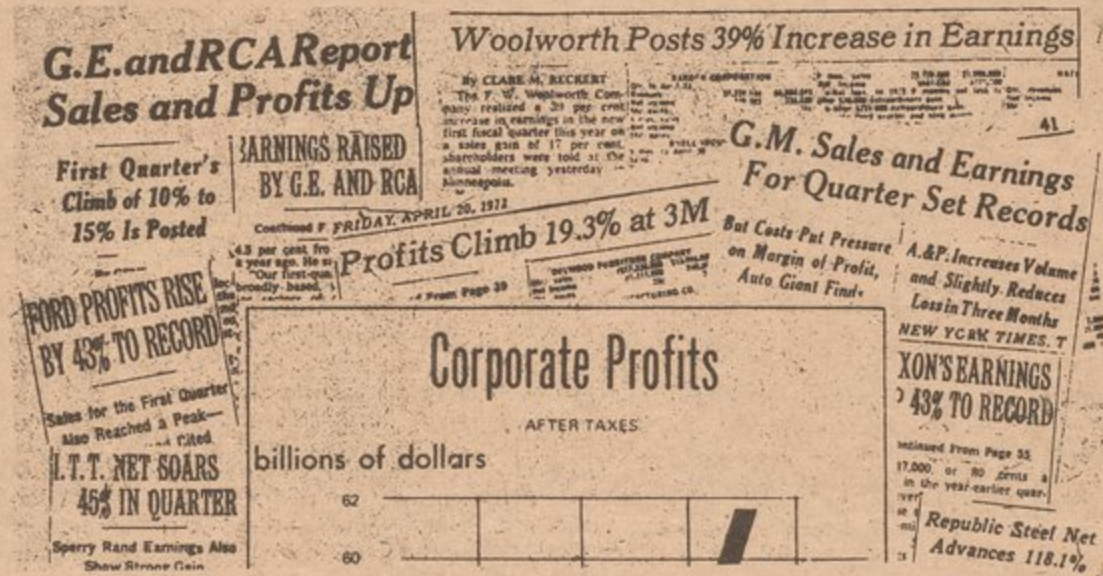
WE PAY MORE, EARN LESS, TO GIVE CORPORATIONS RECORD YEAR FOR PROFITS

No one knows how long Phase Four will last. Nixon and his advisers cannot really solve the problem. It goes beyond them. The Democratic politicians cannot solve it either. There will certainly be other maneuvers following Phase Four, and no doubt the working people will resist the abuse even more strongly.