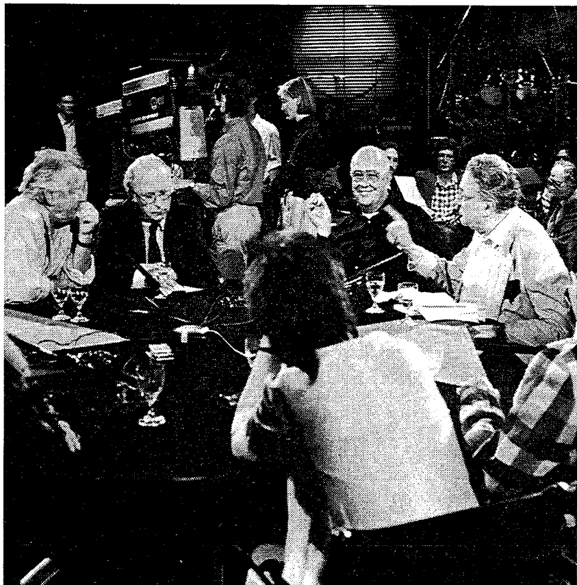
Tijdens een televisiedebat in Duitsland, na de val van de muur.