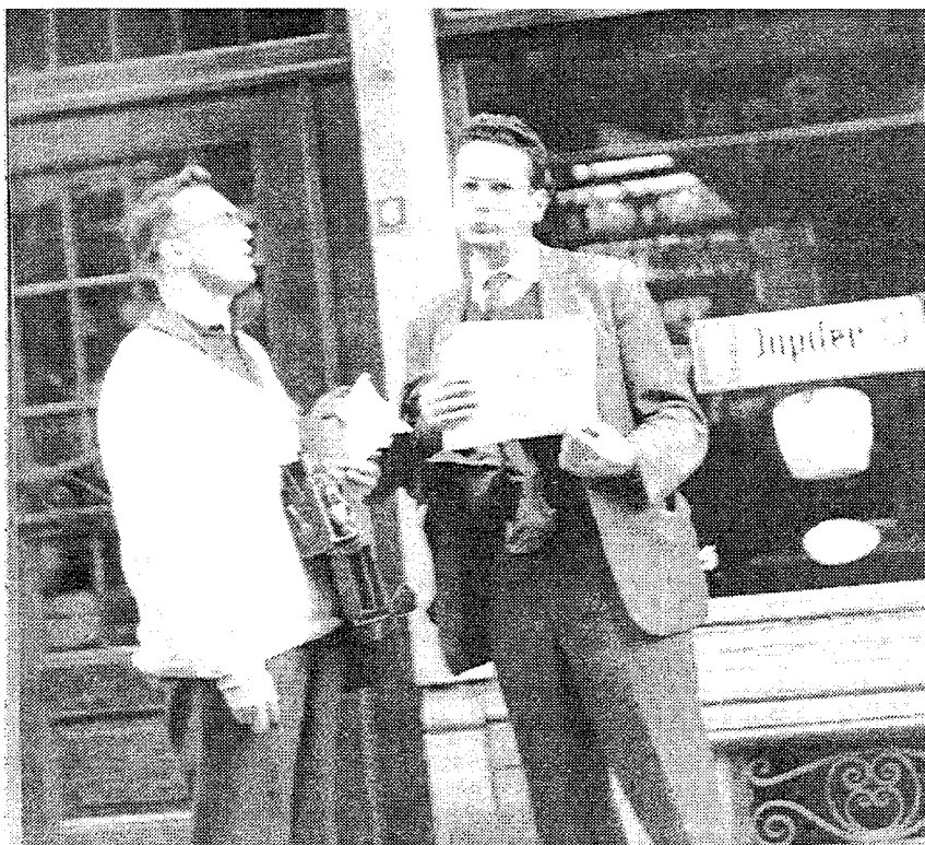
Als verkoper van 'La Gauche' dat hij vanaf 1957 leidt

vruchtbare ervaring. Het levert hem enkele van zijn voornaamste politieke stellingen op, het versterkt zijn militante houding op het terrein en het vormt zijn opmerkelijk vermogen tot theoretische veralgemening, zelden abstrakt, nooit pedant.