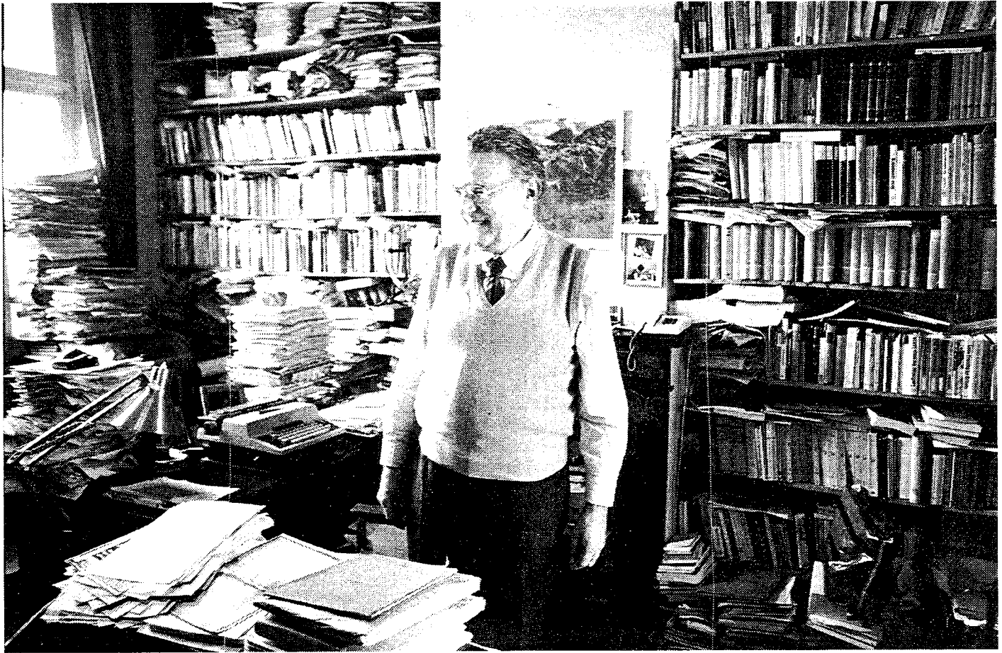
Ernest Mandel in zijn werkkamer te Brussel.

tegenstellingen eigen aan het kapitalisme en van hun kumulatieve verscherping op lange termijn. Sindsdien bevestigde de globale evolutie van de kapitalistische wereld-economie deze 'mandeliaanse' diagnostiek. Vandaag heerst er wereldwijde belangstelling voor de 'lange golventheorie', die Ernest toen in eer herstelde.