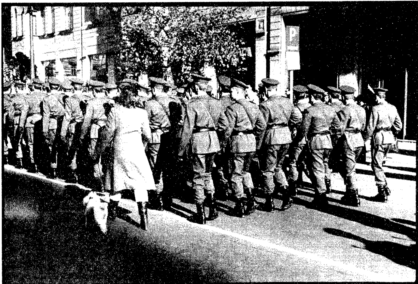
Praag, na de militaire parade.