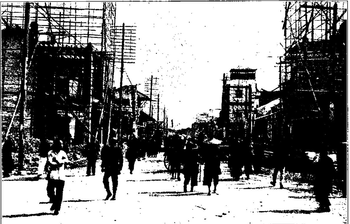
Näköala Cantonin kaupungin uudelleen rakentamisesta. Kuvassa näkyvä katu on uudelleen järjestettävänä. Valmiina se tulee olemaan yksi kaupungin komeimpia katuja.