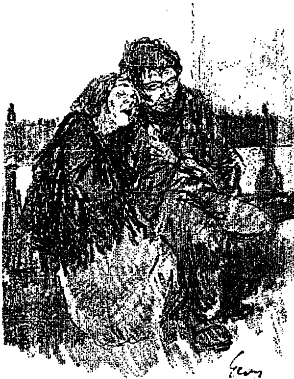
Puistojen penkeillä, jungeleissa viidakoissa on työttömien "koti."

Entiset työttömyys-kaudet ovat aina olleet kiinteässä yhteydessä teollisuus-elämän nousun ja laskun kanssa, mutta tällä kertaa on tilanne aivan toinen.